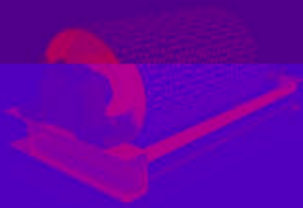
菱形陶瓷包胶 (用于驱动滚筒)